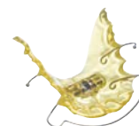
Férulas con tornillo de expansión / retenedoras Material: BIOCRYL® C