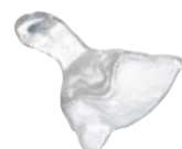
Cubetas individuales Material: IMPRELON® (transparente u opaco)