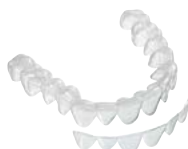
Férulas de blanqueamiento Material: COPYPLAST® o BIOPLAST® bleach