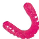
Férulas indicadoras Material: BRUX CHECKER® (rojo)