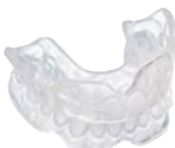
Posicionador Material: BIOPLAST® (transparente)