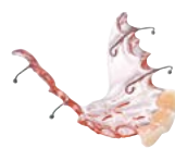
Placas provisionales Material: BIOCRYL® C (rosa-transparente)