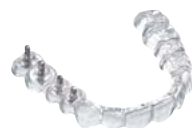
Férulas para implantes Material: DURAN®