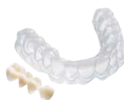
Provisionales Material: COPYPLAST®