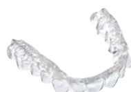
Férulas Material: DURAN® o DURASOFT® pd